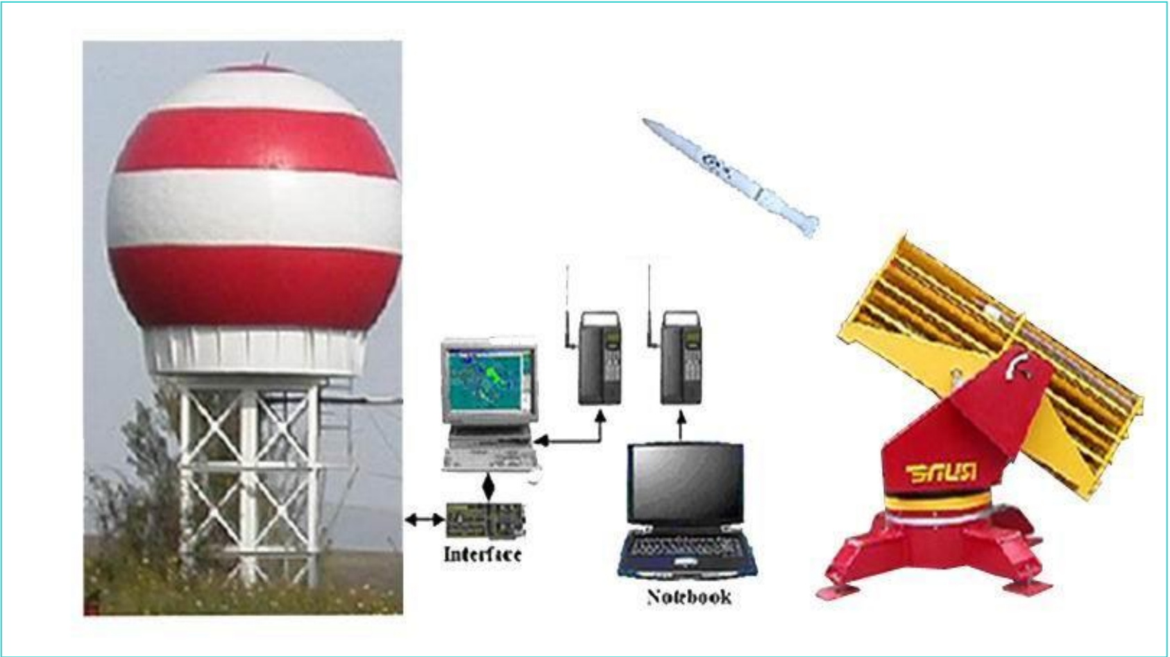
Системаи автоматикунонидашудай «АСУ-МРЛ»