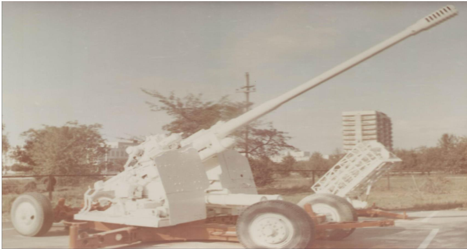
Аслиҳаи зиддиҳавоии 100мм КС-19 расми 1

Аслиҳаи зиддиҳавоии КС-19 аз мушакҳои зидди жолаи «Элбрус-4», ки метавонад дар масофаи то 16 км ҳадафро нишон гирад, 12,25 кило вазн дошта, 8,25 реогенти иодисти нуқраро ташкил медиҳад.