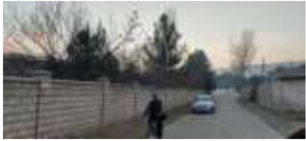
Роҳи даромадгоҳ дар ҳолати хуб