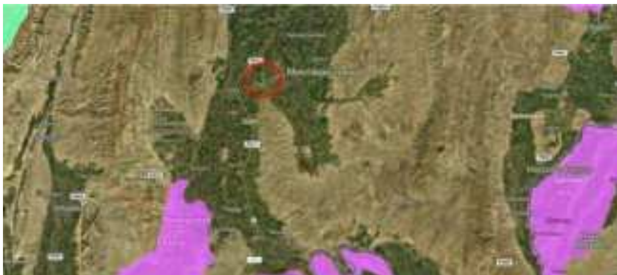
Расми IV.3: Минтақаҳои муҳофизатшаванда