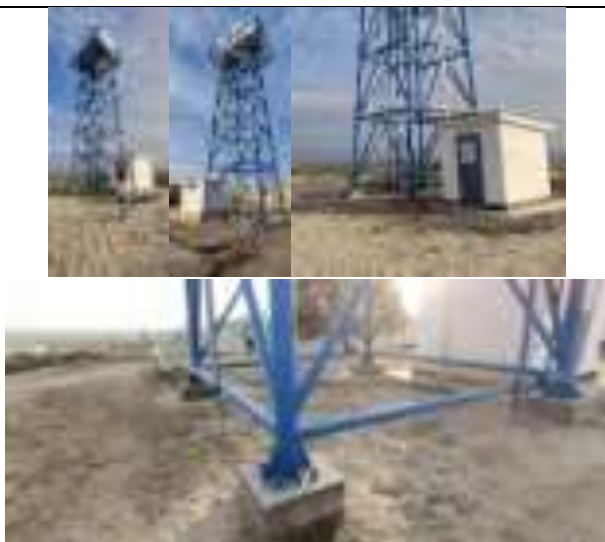
Сурати IV 1: ОНТ, қубури интиқол ва иншооти RO (дар ҳуҷраи хурд) (27/11/2023)

152. Хати обтаъминкунии ноҳияҳои Вахш аз руи лоиҳа ва талаботи филиалҳои Душанбеги «Казводоканалпроект», «Точикгипросельхозстрой» ва «Точикгипрострой» дар солҳои 70—1990 сохта шудааст. Қисми асосии он дар солҳои 1970 сохта шудааст. Обтаъминкунии ҷамоати деҳоти Узун ва Навобод тавассути хати обтаъминкунии Вахш, маркази ноҳия ва дигар ҷамоатҳои боқимонда аз чоҳҳои оби зеризаминӣ дар Узун-1 ва истгоҳи обкашӣ дар НБО дар Узун-2 таъмин карда мешавад. Сарчашмаҳои обтаъминкунии канали Вахш (ВМК) ва аз обҳои зеризаминӣ мебошанд.