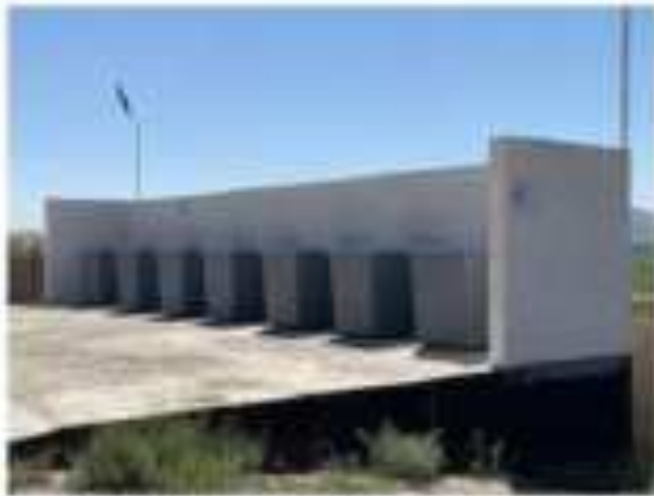
Қуттиҳои партов дар маркази зидди жола