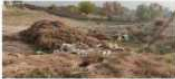
Ҳаҷми қабле дар ҳаҷми қабле 1