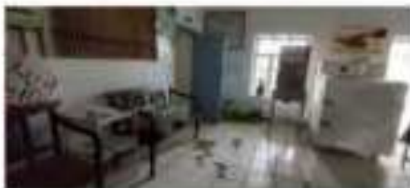
On-site photograph of the structure used for the study. The structure is used for the study.