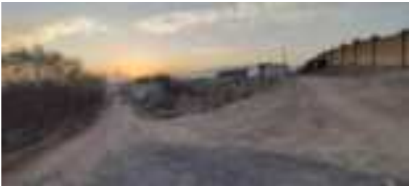
Роҳи заминӣ дар наздикии мавзеи лоиҳа