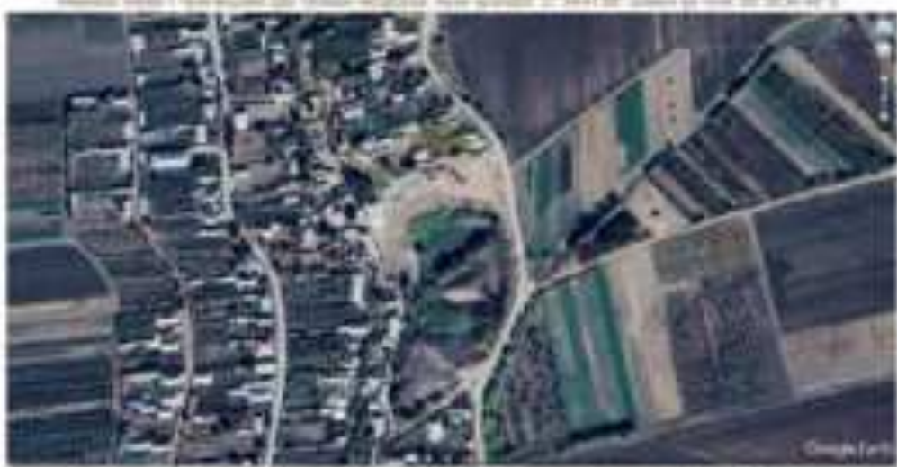
Рис. 1. Вид с воздуха на защитную лесную полосу в степной зоне Волгоградской области (широта 48° 30' 00" N, долгота 42° 30' 00" E).