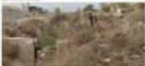
Քաղաքի զանգուշաբերական շրջան