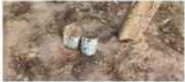
Зарфи қабле ҳаҷми қабле 1 дар сайти Ҷури 1