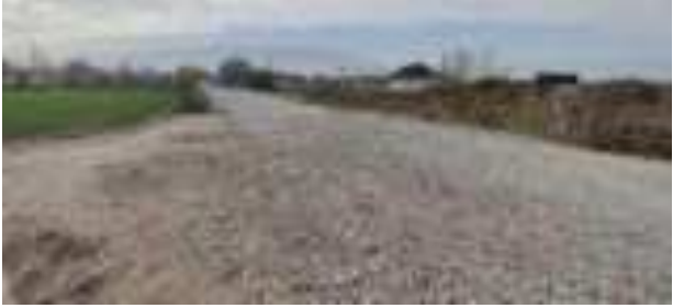
Наздики вайроншудаи Пули-1.