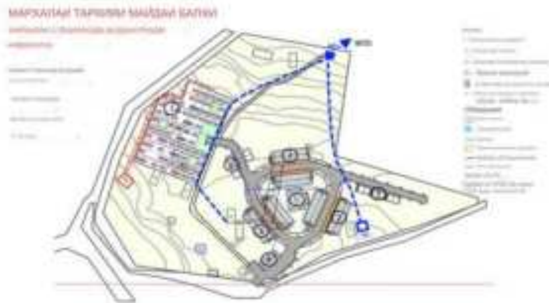
Расми III.3: Нақшаи рушди сайт - Марҳилаи 2