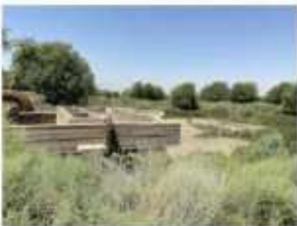
Иншооти обпартои коммуналӣ дар замини шӯравӣ сохта шудааст

163. Соли 2018 дар ноҳия лоиҳаи таҷдид ва навсозии хати канализатсияи маркази ноҳия оғоз гардид. Аз ҷониби ноҳия дар соли 2022 сохтмони иншооти нави тозакунии канализатсия дар мавзеи иншооти пешина бо маблағи 9 млн. фондҳои районӣ.