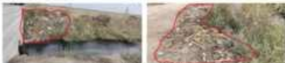
Littered Waste in and around the Street 1