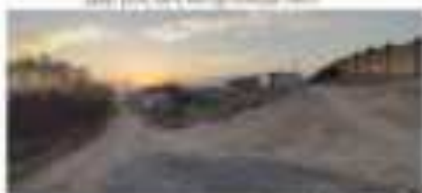
Քաղաքի կենտրոնի արևմտյան կողմը