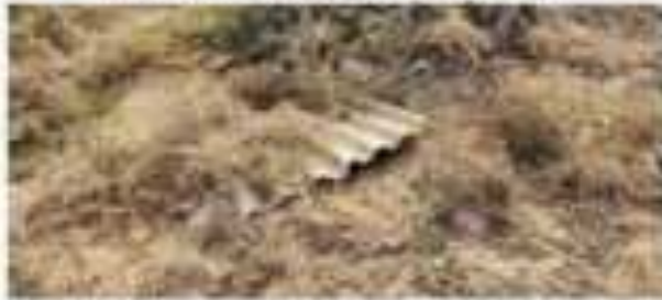
АСМ дар ҳаҷми қабле 1