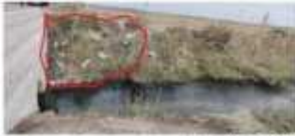
Ҳаҷми қабле АСМ дар ҳаҷми Ҷури 1 ва 2