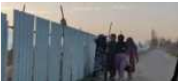
Духтарони маҳаллӣ дар роҳ ба хона