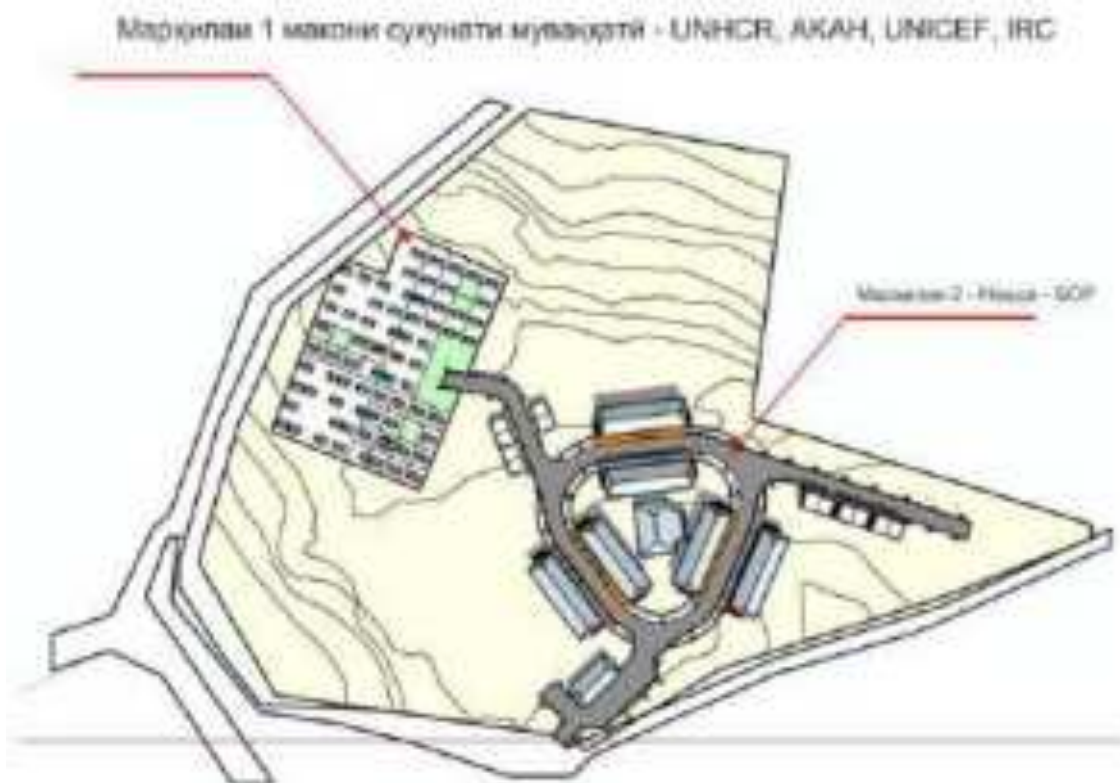
Тасвири III.2: Марҳилаи 1 Нақшаи маҳалли ҷойгиршавӣ – UNHCR, АКАН, UNICEF, IRC