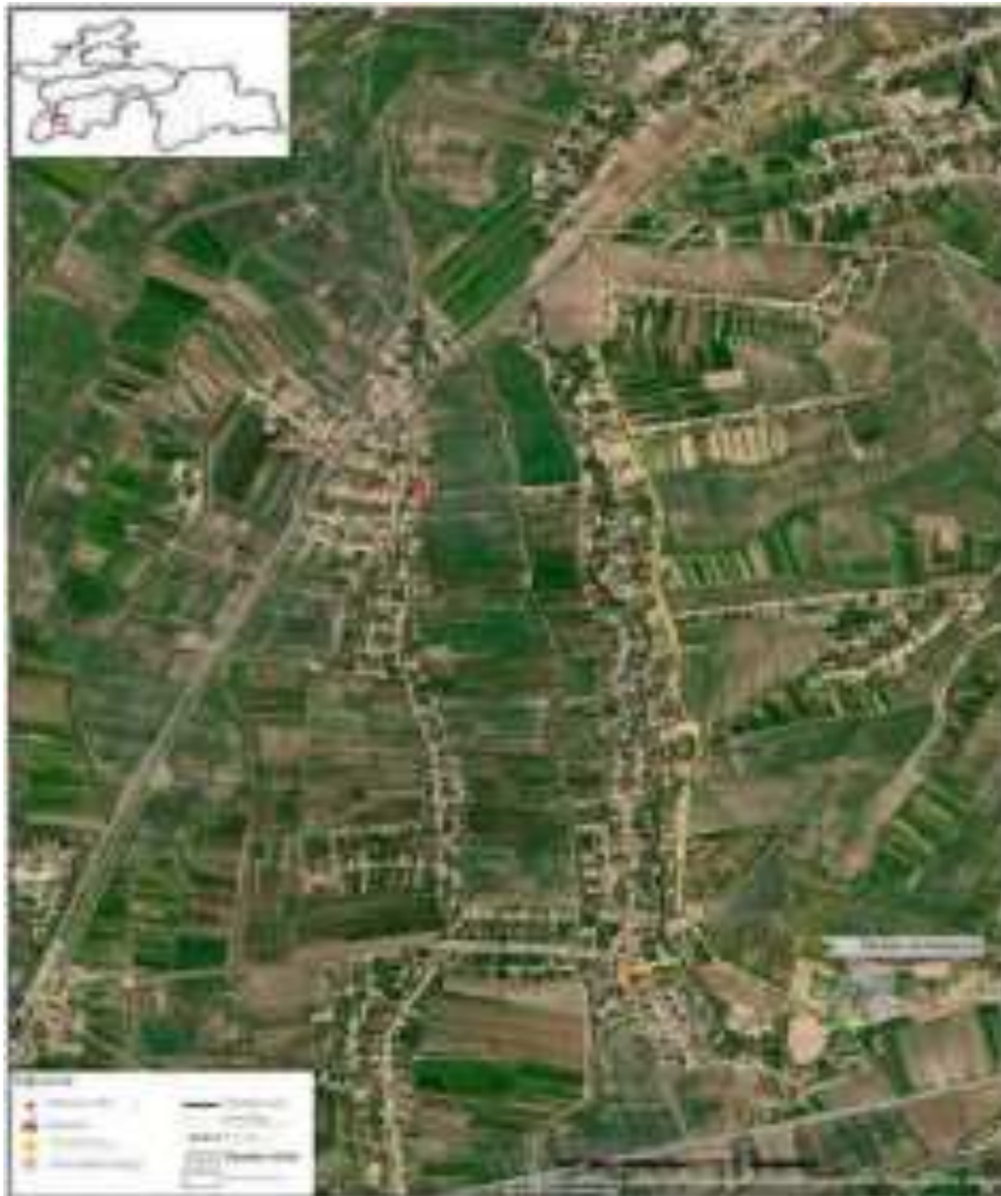
Расми III.1: Ҷойгиршавии ҷузъҳои лоиҳа