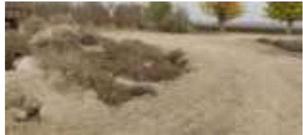
Роҳи замин дар наздикии мавзеи лоиҳа