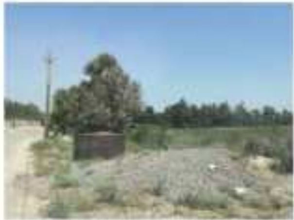
Қуттиҳои партов дар деҳот

Акси IV 10: Қуттиҳои партовгоҳ дар маркази зидди жола ва деҳаҳои атрофи он (23 июни 2022)