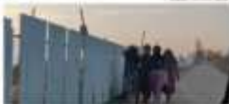
Ջրամուղիների մոտև Կապույտ քաղաքի կողմը