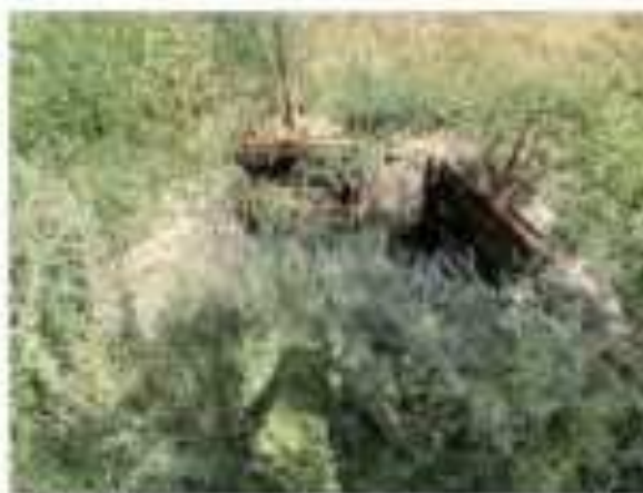
Ҳоки муваққатӣ аз тарафи район истифода мешавад

Акси IV 9: Муассисаи тозакунии канализатсия - ноҳияи Ҷалолиддини Балхӣ (23 юни 2022)