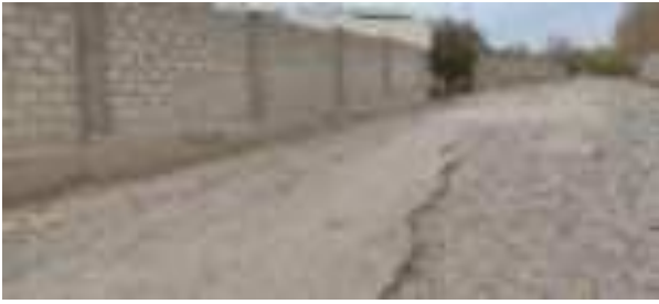
Роҳи сангфарш вайроншуда