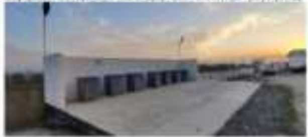
Ҳаҷми қабле ҳаҷми қабле 1