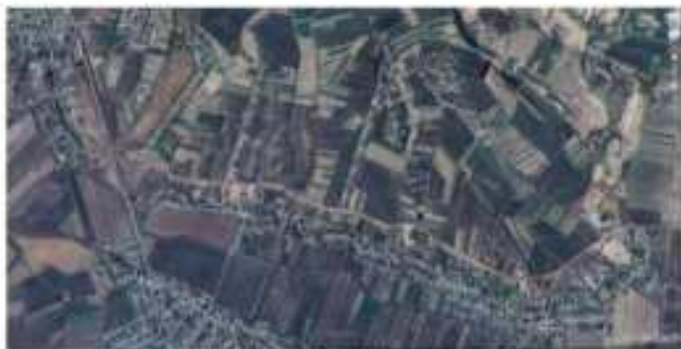
Жаңы илгерилек: Сапар илгерилек үчкөтү АКЦИОНЕРЛІК ТӨЛӨКӨН КАЛЫВАНД ИМАРАТ