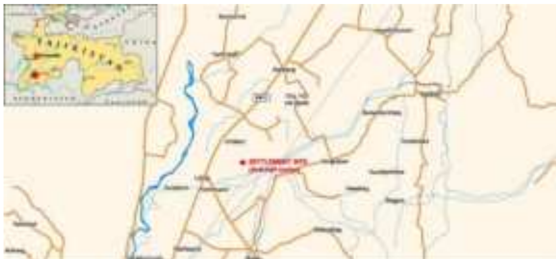
Расми 0.1: Харитаи ҷойгиршавӣ

3. Лоиҳа ҳамчунин беҳбуди иншооти инфрасохтори хизматрасонии иҷтимоӣ дар деҳаҳои гирду атрофи Ҷамоати деҳоти Золи Зар дар ноҳияи Ҷалолиддини Балхӣ, аз қабилӣ барқарорсозии пул, роҳи даромадгоҳ ба маркази зидди жола, нерӯи барқ, хатҳои таксимкунӣ, иншоотҳои санитарии мактаби рақами 29-и деҳаи Саноат ва хариди таҷҳизоти зарурии тиббӣ барои пункти тиббиро дар бар мегирад. Дар расми зер харитаи ҷойгиршавӣ оварда шудааст.