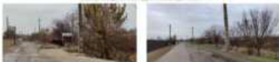
Дат көчмөдөкү бүтүрмөсү бүткөн көчө жаңыланган.