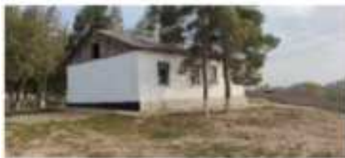
18.02.2023 - ҷамъият - маҷлис

Сурати V 1: Маводи дорои асбест дар бом ва девори ҳоҷатхонаи мактаб ва биноҳои кӯчонидашуда вайрон карда мешавад (27 ноябри соли 2023 ва 12 декабри соли 2023)