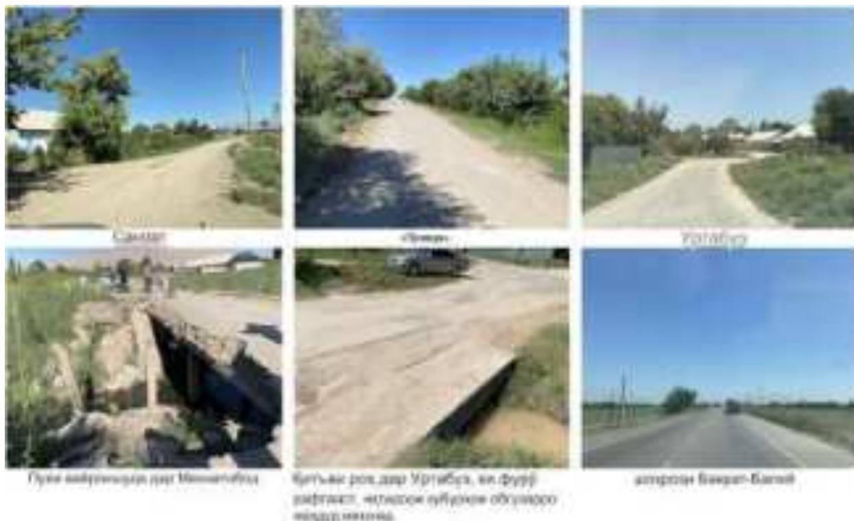
Сурати V 4: Ҳолати роҳҳо (29 июни 2022)

нақлиёти марбут ба лоиҳа ба вучуд омадааст, кўмак хоҳад кард. Ҳисобот бояд аз ҷониби МТЛ ва ГТЛ пеш аз оғози корҳои сохтмони лоиҳа тасдиқ карда шавад.