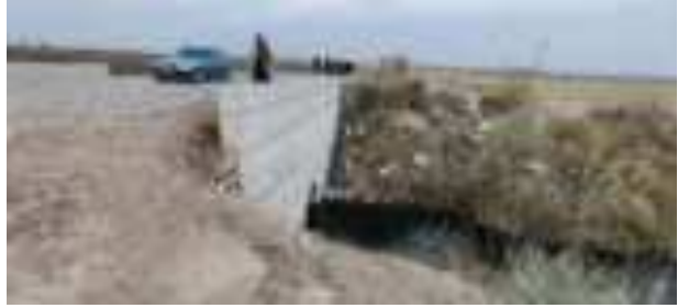
Намуди паҳлӯии Пули-1