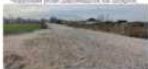
Քաղաքի կենտրոնի արևմտյան կողմը