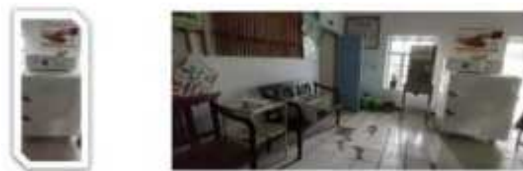
Сурати IV 7: Огоҳӣ аз ҷониби лоиҳа ба Маркази тиббӣ дода шудааст (12.12.2023)