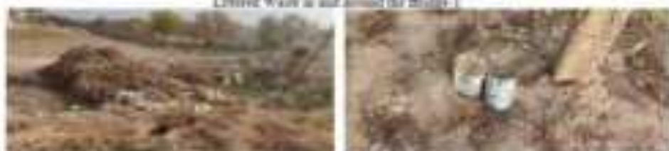
Littered waste inside the project site