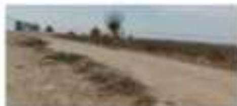
Ճայ քաղաքի արևմտյան կողմը