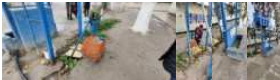
Сурати IV 2: Туби дастӣ (чуқури 11 м) Сурати IV 3: Туби дастӣ бо зарфи болоӣ

153. Ҳангоми аз назар гузаронидан ба мактабу пунктҳои тиббӣ маълум гардид, ки обтаъминкунии онҳо аз оби зеризаминӣ мебошад. Дар шаҳраки мактаб қубури 11 метр бо насоси дастӣ мавҷуд аст, ки барои таъмини оби мактаб истифода мешавад. Инчунин як шабакаи қубур мавҷуд аст, ки иншооти болоии бакро бо насоси зеринӣ пур мекунад.