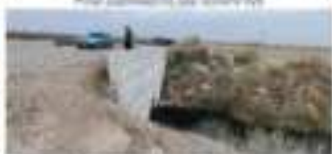
Քաղաքի կենտրոնի արևմտյան կողմը