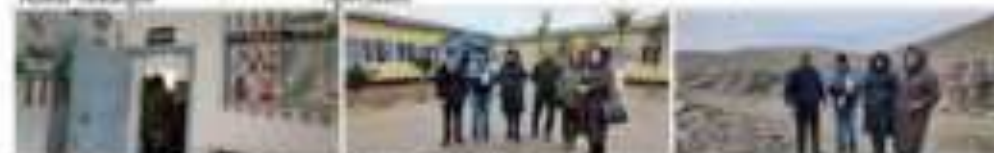
Participants of Medical Centre, School and Landfill Sites (left to right respectively) visit in Portau