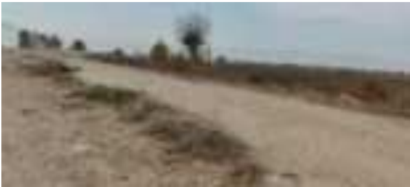
Дар роҳ ҳеҷ китф/роҳи пиёдагард нест

1 Корпоратсияи байналмилалӣ молиявӣ. 2007. Дастур оид ба муҳити зист, саломатӣ ва бехатарӣ (МСЗБ). Дастурҳои умумии МСЗБ. Муҳити зист. Идоракунии маводҳои хатарнок.