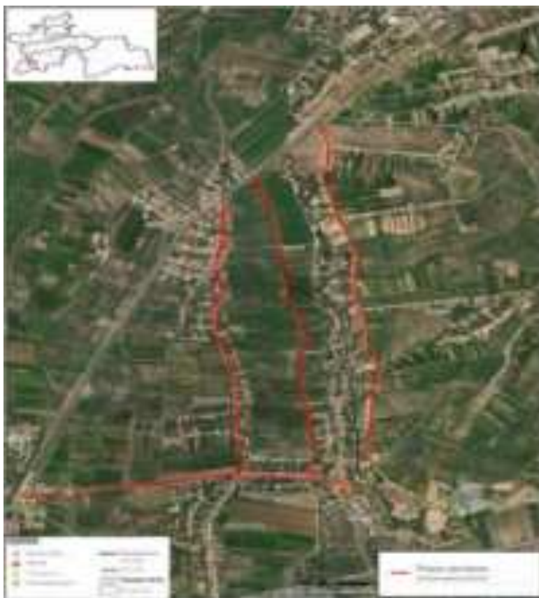
Расми V.1: Роҳҳои алтернативии дастрасӣ

223. Дар рафти вохӯриҳои машваратӣ мардуми маҳаллӣ изҳор доштанд, ки ҳангоми бунёди иншооти истиқоматии муваққатӣ роҳҳои деҳа аз ҷониби мошинҳои боркаш зарар дидаанд. Гузаргоҳи роҳ дар Уртабуз бар асари ҳаракати зуд-зуди мошинҳои вазнин фурӯ рехт, ки ҳоло дар пайи боришоти шадид боиси обхезӣ дар манотиқи атроф мешавад. Мардуми маҳаллӣ аз он нигаронанд, ки аз сабаби ҳаракати мошинҳои сохтмонӣ шароити роҳи мавҷудаи деҳа бадтар мешавад. Мардуми маҳаллӣ хоҳиш карданд, ки беҳбудии роҳҳои деҳа ба лоиҳа дохил карда шаванд.