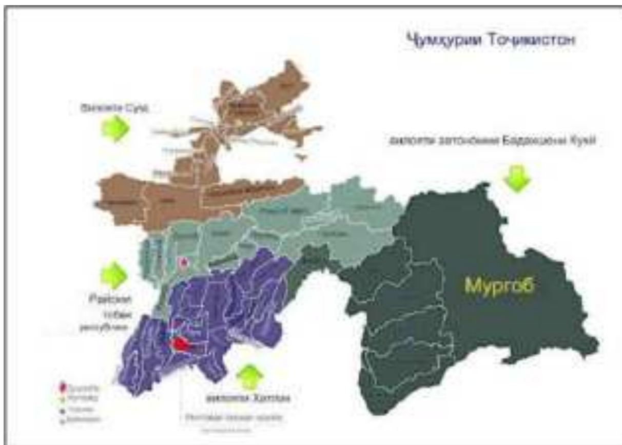
Расми IV.1: Ҷойгоҳи лоиҳа ва ноҳияи Ҷалолиддини Балхӣ