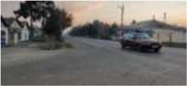
Чорроҳаи роҳи даромадгоҳ ба шоҳроҳ