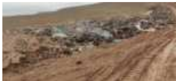
Партовҳо дар канори роҳ партофта мешаванд