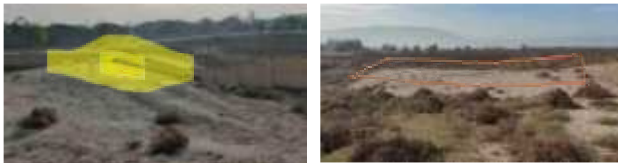
Сурати IV 8: Системаи мавҷудаи идоракунии канализатсия – Минтақаи кӯчонидани аҳоли (27/11/23)

160. Муассисаи ҳисоббаробаркунӣ. Муассисаи муҳочиркунонӣ дорои иншооти тозакунандаи канализатсия ё септики дорои зарфияти 200 м 3 мебошад. Иншоот дар қисмати шимолии маҷмаа дар назди девор ва роҳи баромад ба иншооти кӯчдиҳӣ ҷойгир аст. Иншоот метавонад обҳои канализатсияро аз ҳоҷатхонаҳо ва майдони хаймаи муваққатӣ ҷойгир кунад.