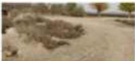
Մեծ Կարմիր ձորի արևմտյան կողմը