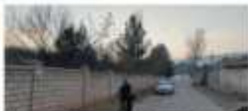
Քաղաքի արևմտյան կողմը