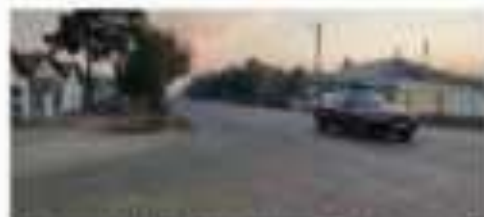
Քաղաքի կենտրոնի արևմտյան կողմը

Քաղաքի անասնաբույժների զբոսայգիի մոտ կա մեծ քանակությամբ անասնաբույժների և զանազան տեսակի զանազան կենդանիների բնակավայրեր։ Այստեղ էլ, ընդհանուր առմամբ, չեն արվում անհրաժեշտ միջոցառումները, որոնք կարող են նպաստել կենդանիների առողջապահությանը և կրթությանը։ Այս ծրագրի շրջանակներում կատարվելու է միջոցառումներ, որոնք կարող են նպաստել կենդանիների առողջապահությանը և կրթությանը։