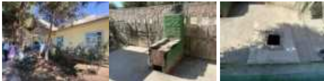
Маркази тиббии Саноат

159. Ба гуфтаи ҳамшираҳои шафқат ва кормандони марказҳои тиббӣ бемориҳо ва шикоятҳои сокинони деҳот фишори баланди хун, диабети қанд, шамолхӯрӣ, дарунравӣ, бемориҳои меъдаю рӯда мебошанд.