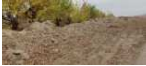
Хоки фуфуси гилин дар канори роҳ

1 Корпоратсияи байналмилалӣ молиявӣ. 2007. Дастур оид ба муҳити зист, саломатӣ ва бехатарӣ (МСЗБ). Дастурҳои умумии МСЗБ. Муҳити зист. Идоракунии маводҳои хатарнок.