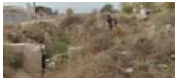
Кӯдакон дар назди роҳ бозӣ мекунанд